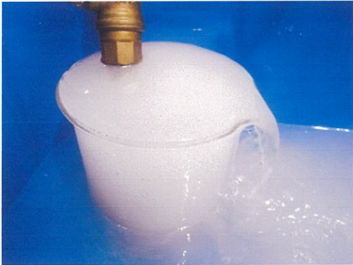
写真1 マイクロナノバブル水