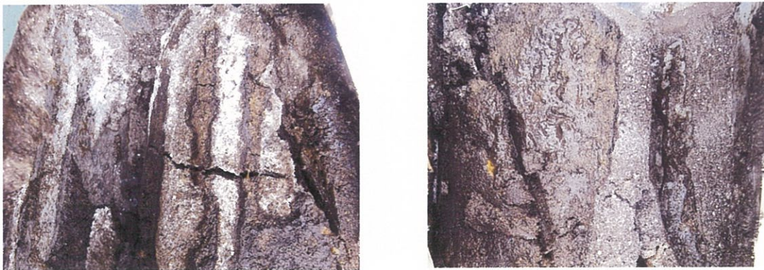
写真5 土壌断面（左：水+消石灰、右：MNB+消石灰）

今回の実験ではEC、硝酸イオン濃度ともMNB+消石灰の方が小さく、除塩効果が大いことがわかる。なお表層のECがどちらも高い理由は、塩類の他に消石灰もEC（電気伝導度）に反応するからである。消石灰は除塩するが表土に残るため強アルカリ性になりしばらく栽培はできないという欠点がある。土壌の断面（写真5）を見ても水では消石灰が上部に残っているのがわかる。しかしMNBは中まで染み込み、散布した消石灰をよく洗い流していることから、早く栽培が可能になると想像できる。