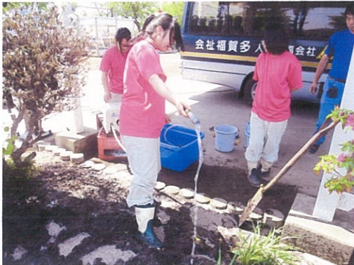
写真9 浜市川保育園の花壇再生活動（6月）