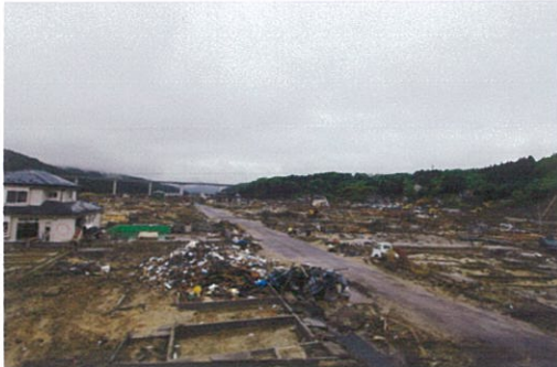
写真7 岩手県山田町の被災状況