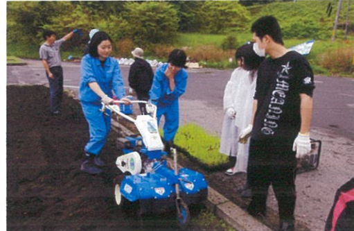
写真8 山田町の花壇再生活動（5月）