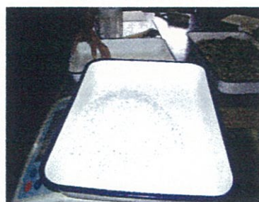
写真2 発泡スチロール粉