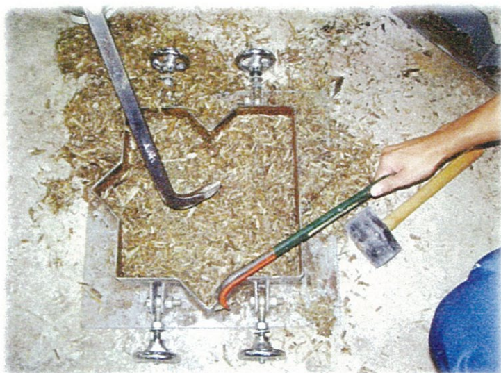
写真6 歩道板失敗例

写真5は歩道板が固まってきれいに脱型できたものです。湿っている場合は自然乾燥させます。写真6は歩道板が固まらず脱型する前にボロボロと崩れたときは、「失敗」なのでバールなどを使用して木材をかき出します。