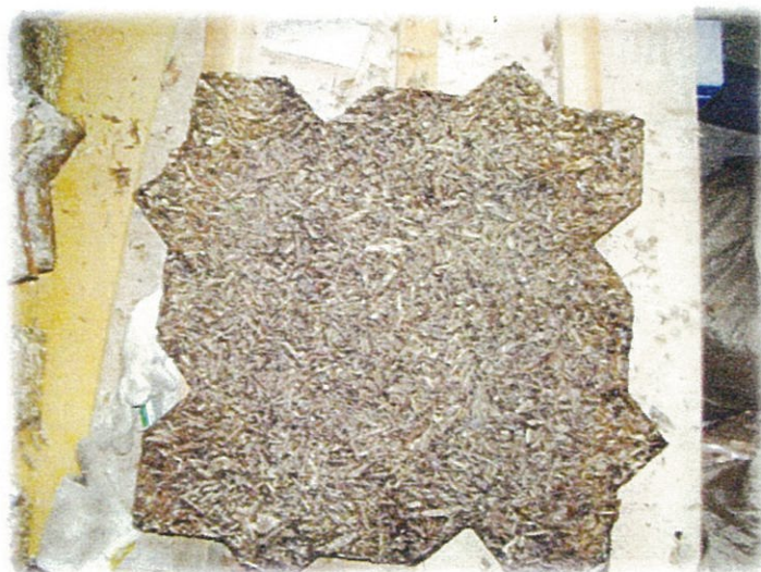
写真5 歩道板成功例